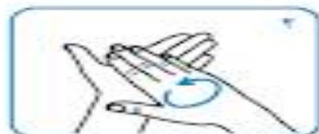
کف دو دست را به هم بمالید