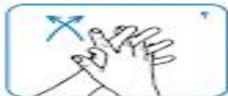
کف به کف یا انگشتان در هم رفته