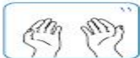
حالا دست‌های شما ایمن هستند