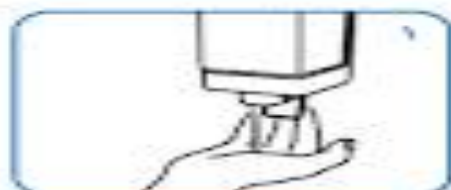
مقدار کافی صابون، که تمام سطح دست را بپوشاند، استفاده کنید