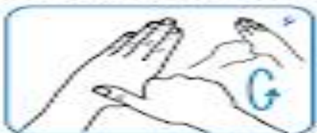
مالیدن چرخشی شست چپ در حالت دربر گرفته شده یا کف دست راست و برعکس