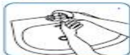
دست‌ها را با آب خیس کنید