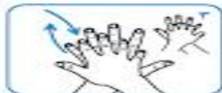
کف دست راست پشت دست چپ، یا در هم رفتگی انگشتان