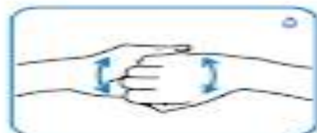
پشت انگشتان به کف دست مقابل