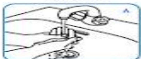
شستن دست‌ها با آب