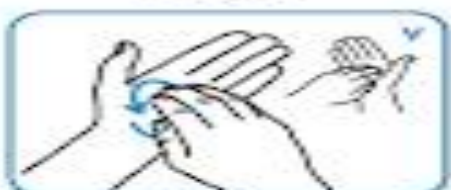
مالیدن چرخشی به عقب و جلو یا انگشتان به هم چسبیده دست راست در کف دست چپ و برعکس